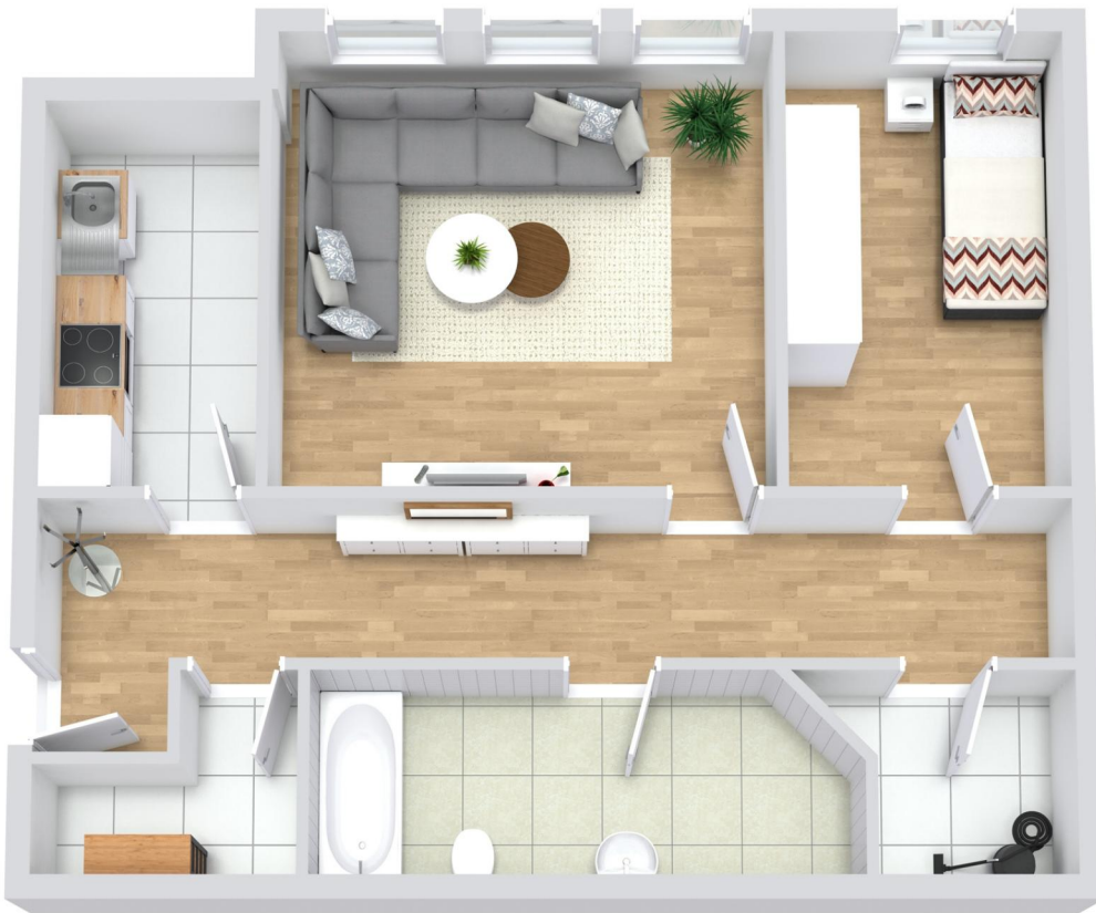
Grundriss 1.OG links SE - WE08 - unmaßstäblich -